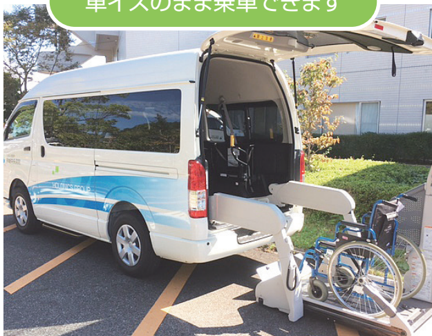
車イスのまま乗車できます