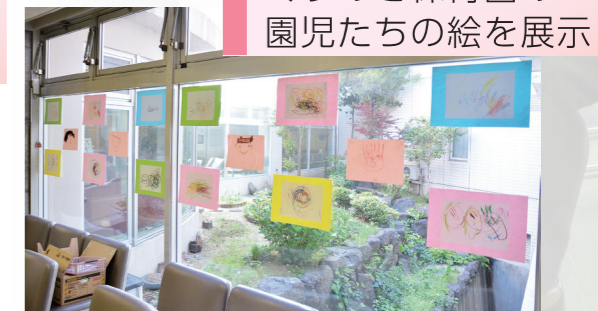
くすのき保育園の園児たちの絵を展示