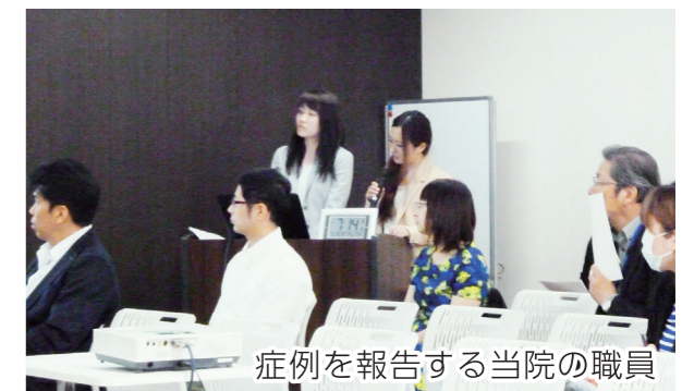
症例を報告する当院の職員