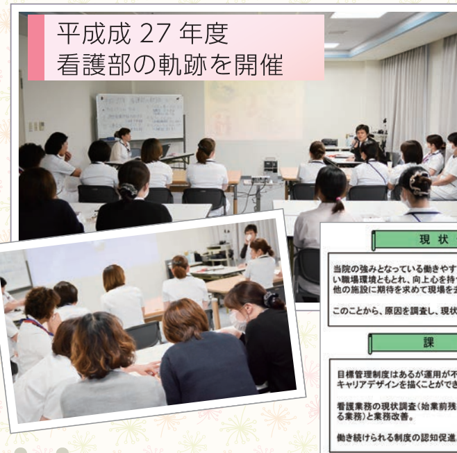
平成27年度 看護部の軌跡を開催

現状分析 当院の強みとなっている働きやすさは、視点を変えれば刺激が少ない職場環境ともとれ、向上心を持つ職員のモチベーションが下がり、他の施設に期待を求めて現場を去っていく一因と推測される。このことから、原因を調査し、現状を把握する必要がある。 課題 目標管理制度はあるが運用が不十分のために、個々の看護職員がキャリアデザインを描くことができるような働きかけができていない。看護業務の現状調査(始業前残業・ライフステージ別負担と感じている業務)と業務改善。 働き続けられる制度の認知促進。