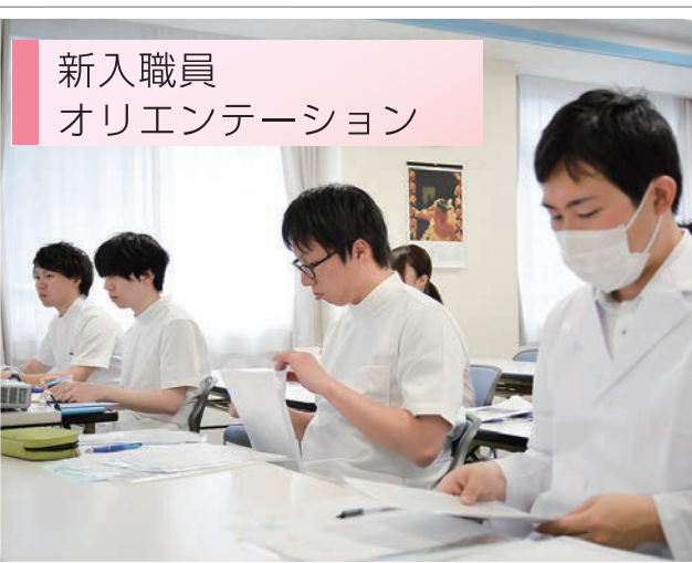
新入職員 オリエンテーション