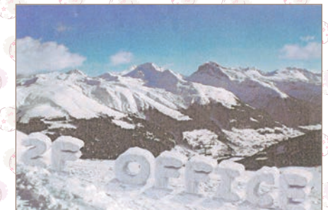
2階事務所(総務課、業務課)