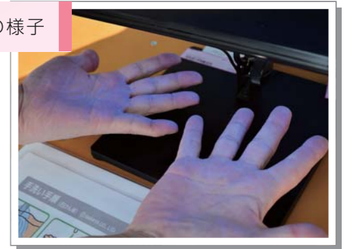
手洗い体験の様子

手洗い体験コーナーでは、蛍光ローションを手に塗り、特殊なライトにかざすと菌が青白く光る様子を見ていただき、正しい手洗いの仕方を学んでいただきました。