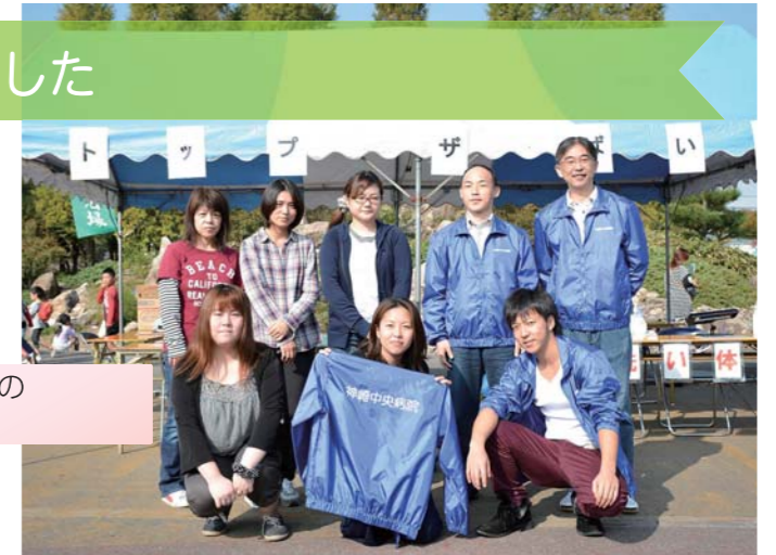
参加したCS部会のメンバー

東近江市制10周年記念事業として五個荘記念公園で開催された「てんびんの里ふれあい広場 2015」に、神崎中央病院のCS部会が出店しました。