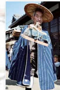
← 天秤棒を担いだ近江商人

天秤棒を肩に、全国で飛躍した近江商人。東近江市五個荘地区は、近江商人のふるさとと伝えられています。この地区では、白壁や舟板塀の土蔵・近江商人本宅など、かつて近江商人が往時を歩き交った街並みが現在も色濃く残っています。