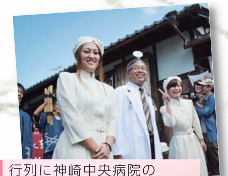
行列に神崎中央病院の若手看護師2人が参加！