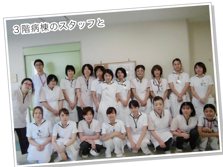
3階病棟のスタッフと

ISO の維持審査を終え、これから改善すべきことをふまえ、質の高い看護が提供できるようスタッフ全員で頑張ります。また、ホスピタリティに基づき魅力ある病棟にしていこうと思えますのでこれからも宜しくお願いします。