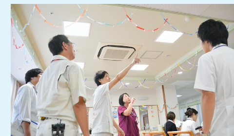
運動会の会場設営について打ち合わせ中です

ようやくくだるような暑さもおちつき、きもちよい季節になってきました。当院回復期リハビリテーション病棟では、今秋、初の試み!!運動会を計画しています。現在病棟スタッフ、リハビリスタッフと共に練りに練って、準備をすすめています。スタッフが実際に車いすにのってシミュレーション