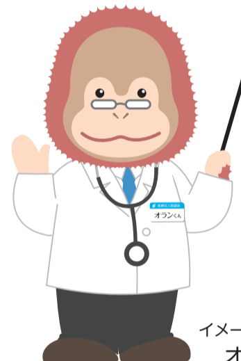
イメージキャラクター オランくん