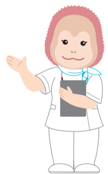
イメージキャラクター ウータンちゃん