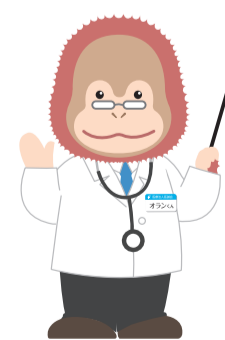
イメージキャラクター オランくん