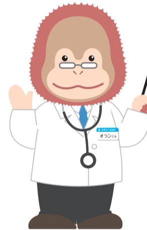
イメージキャラクター オランくん

2021年1月4日(月)より、八日市コースの時刻を変更いたします。 ご確認のうえご利用いただきますよう、 お願い申し上げます。