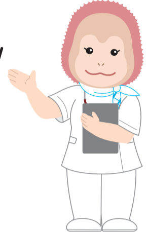
イメージキャラクター ウータンちゃん