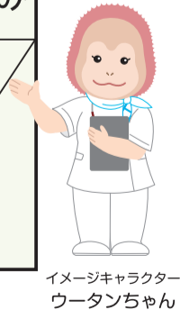
イメージキャラクター ウータンちゃん