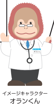
イメージキャラクター オランくん